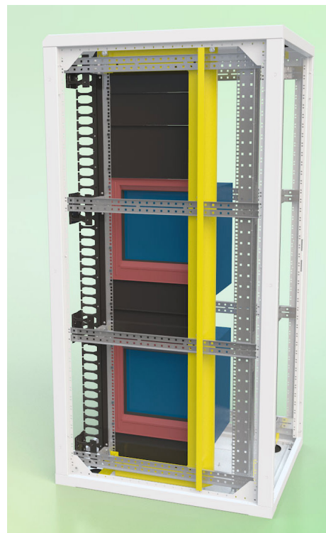
Detail adaptérů, záslepných panelů a separačního rámu. Rozvaděč – Size 1.