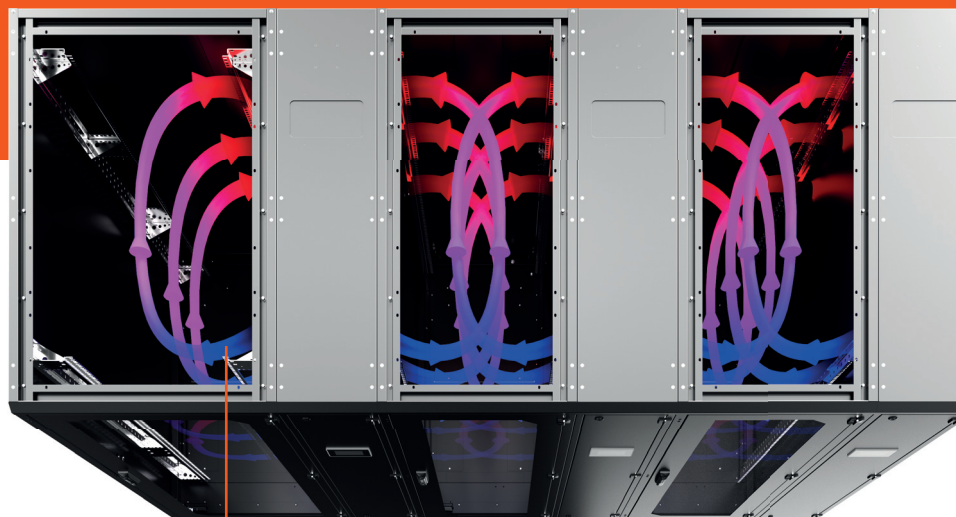
Schéma proudění chlazeného vzduchu v MCL