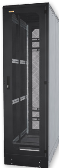
Die Schrankarchitektur im Warm-/Kaltgangkonzept erfordert belüftete Vordertür (86%) und belüftete Hintertür (86%) zum einfachen Zutritt zum Gang.