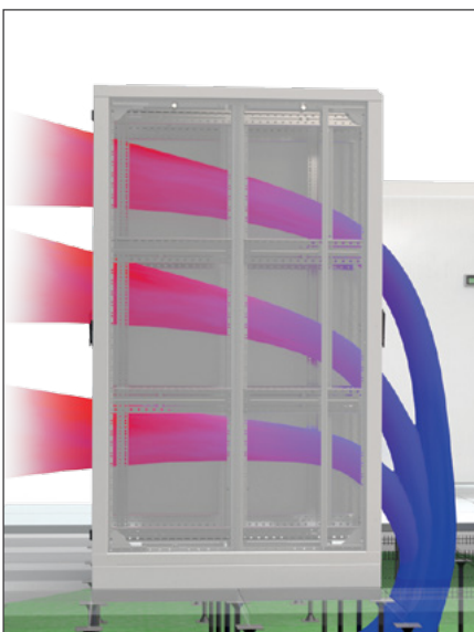
Die Kaltluft wird zum Kaltgang durch den Doppelboden als Kaltluftsammlerraum befördert. Die Warmluft wird auf der Hinterseite zum Warmgang ausgeblasen.

Die Warm-/Kaltgangarchitektur kann auf verschiedene Weise modifiziert werden, um heutigen höheren Energieeffizienzanforderungen gerecht zu werden. Sie kann einfach mit der Einhausungslösung verbessert werden (d.h. durch die Trennung von Kalt- und Warmluftstrom). Für mehr Info siehe das nächste Kapitel.