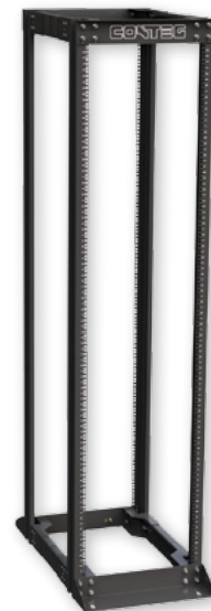
Die offenen Gestelle der Serie RSG (zwei und vier Holmen) sind eine Schrankalternative, die Ihnen einen optimalen Zutritt zu installierten Geräten gewährleistet.